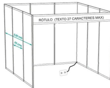
STAND TIPO PASILLO